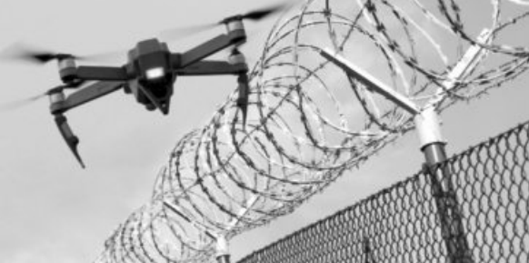
After the attack on Jammu airbase on June 27, multiple agencies did a preliminary evaluation of at least six-to-seven indigenous systems